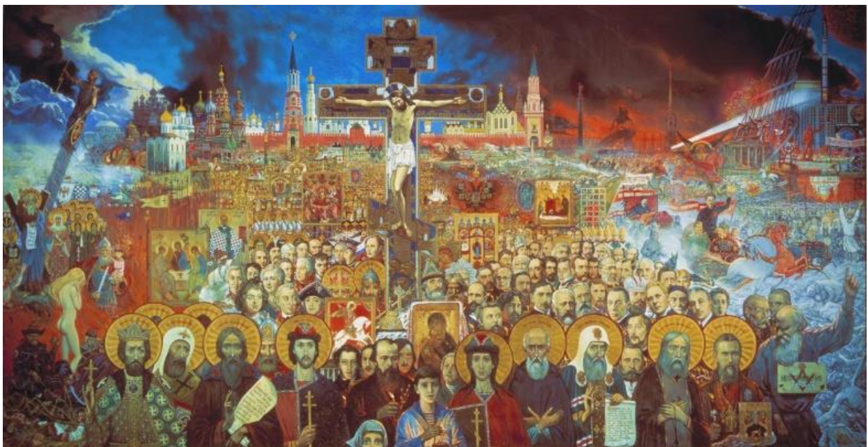
(Илья Глазунов Русь вечная )

Ни одной капли крови, пота, слезы не было пролито зря. И наши братья, отдавшие жизнь, - ангелы Донбасса навсегда! Мы Святая Русь, мы лучший цвет современной России, куда стекались храбрые добровольцы, они ни за деньги, не за государственные льготы отдали свою жизнь. К Новороссии направлены наши взоры, рвения и устремления сердец лучших людей Руси, от Закарпатской Руси до Приморской Руси, от Поморской Руси до древней Тавриды, где ныне наши соотечественники обрели в родной гавани счастья и свободу.