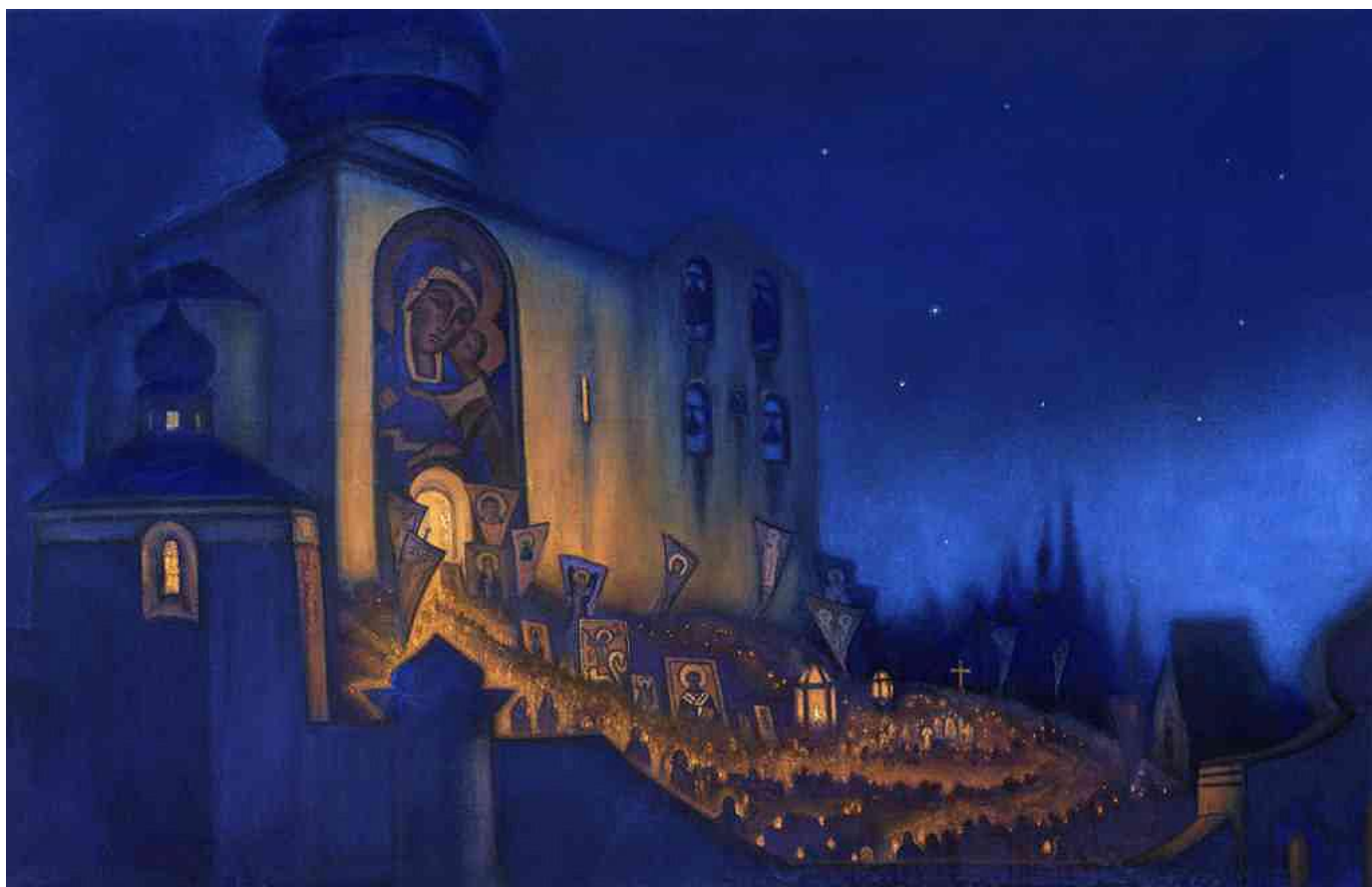
(Рерих, Русская Пасха)

О Русь, о Новороссия, я вновь к вам обращаюсь, мы проходим свою Голгофу, свое распятие, но знайте, уже скоро грядет наша Победа. Мы должны осознать и покаяться в своих грехах, из-за чего постигли нас беды: в грехе забвения веры в Бога, в детоубийстве – в абортах, в предательстве своей истории. Тогда горькие беды и нещадные враги не коснутся нас. После смерти – следует Воскресение, после наших страданий – мир и возрождение!