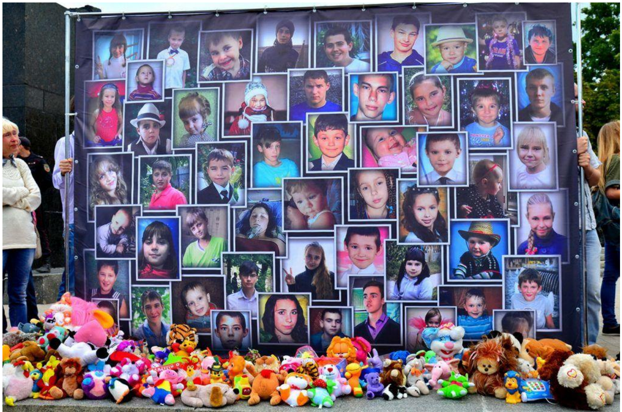
(Нас убила Украина)

Ни одной капли крови, пота, слезы не было пролито зря. И наши братья, отдавшие жизнь, - ангелы Донбасса навсегда! Мы Святая Русь, мы лучший цвет современной России, куда стекались храбрые добровольцы, они ни за деньги, не за государственные льготы отдали свою жизнь. К Новороссии направлены наши взоры, рвения и устремления сердец лучших людей Руси, от Закарпатской Руси до Приморской Руси, от Поморской Руси до древней Тавриды, где ныне наши соотечественники обрели в родной гавани счастья и свободу.