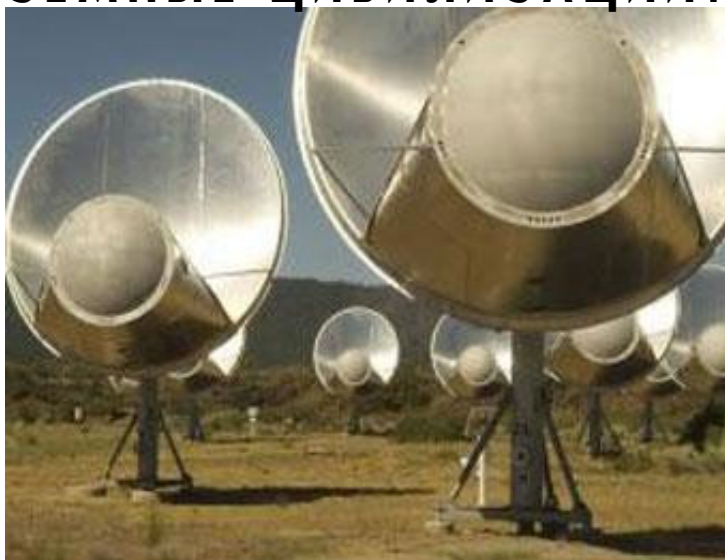
Радиотелескоп Алена для поисков сигналов из космоса. Калифорния 2008 г.

Насколько опасно обнаружить себя перед более развитыми цивилизациями Космоса? Эти опасения лишены всякого основания. Ведь нас давно можно было бы обнаружить по излучениям наших телевизионных станций и радаров.