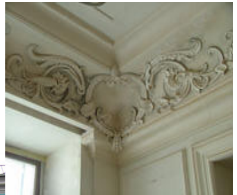
Лепнина на потолке. Интерьер.

Дом-комод Апраксиных -Трубецких на Покровке. 1766 г.